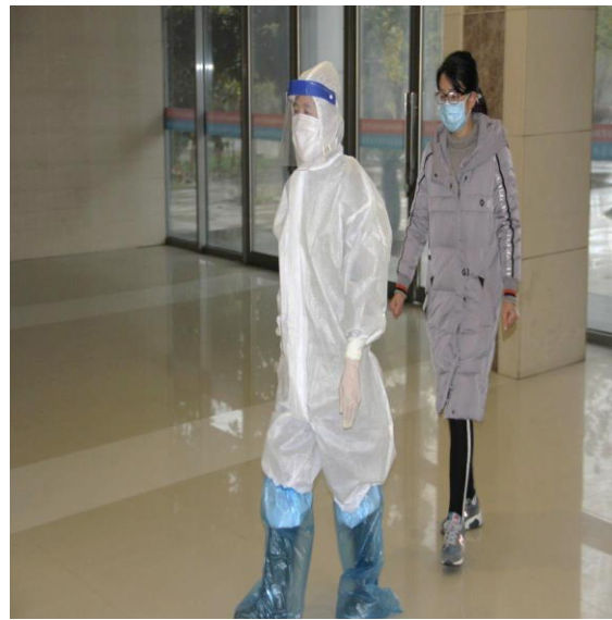
3.班主任将学生带到医务室并通知家长