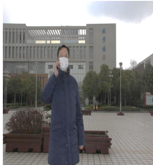
7.值班副校长了解情况并向学校汇报