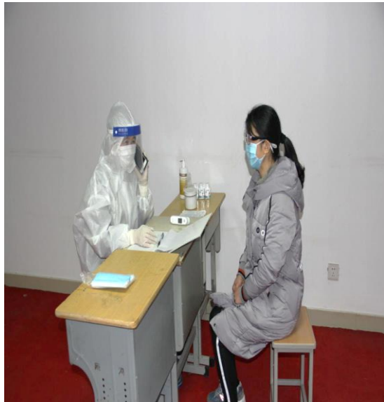
6.值班医生向校防控工作组汇报