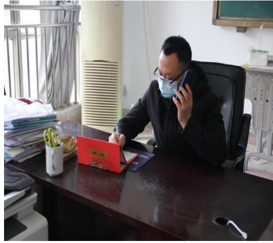
2.系部主任向学校领导汇报