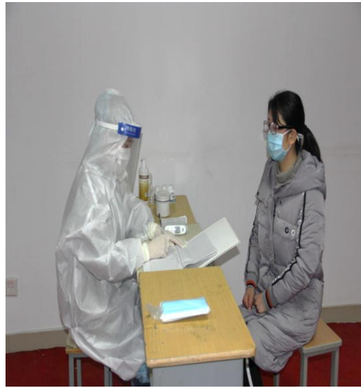
5.值班医生对发热学生进行体温复测和流行病学史四项调查