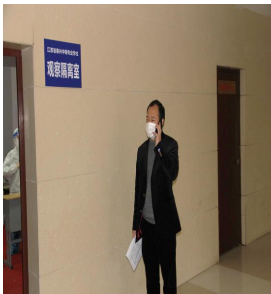
8.学校安管办主任通知对教室消毒