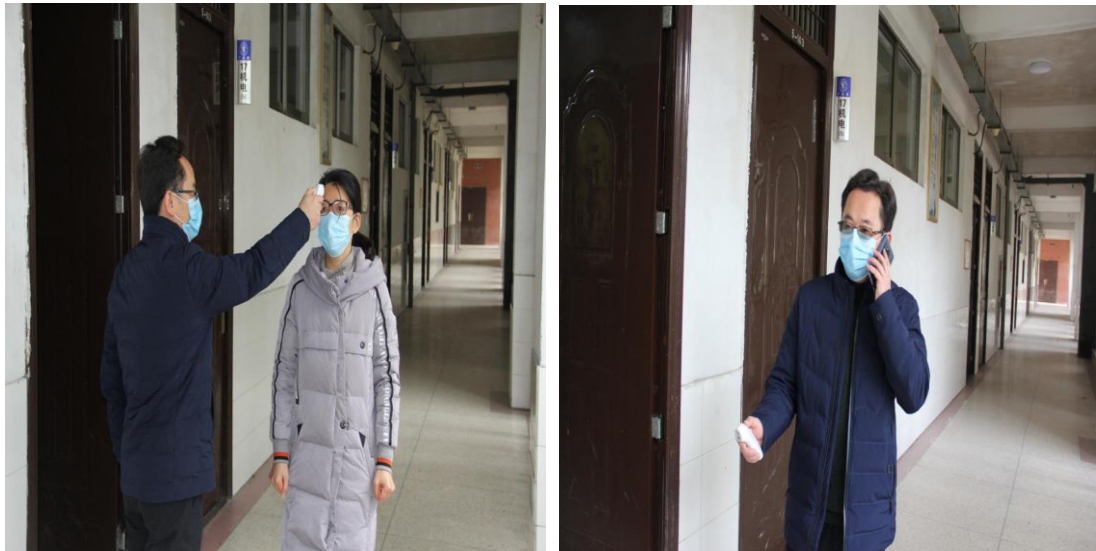
1.班主任发现发热学生后并向系部主任汇报