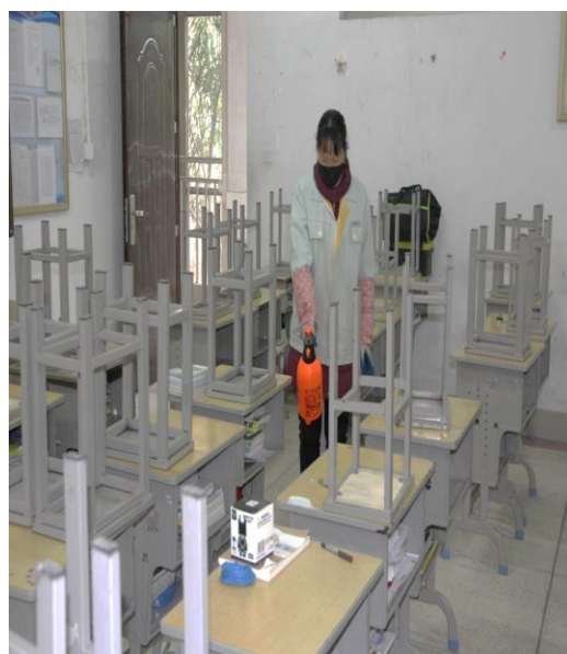
9.后勤人员对班级进行消毒